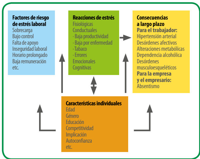
Figura 2. Mecanismo de producción del estrés laboral.

El estrés laboral afecta al menos a 40 millones de trabajadores de la Unión Europea y, según los últimos datos de la Eurofound, los países de la Unión Europea invierten 20.000 millones de euros al año para combatirlo. Además de producir efectos nocivos en la salud de los trabajadores, ocasiona alteraciones muy importantes de la productividad y la competitividad de las empresas.