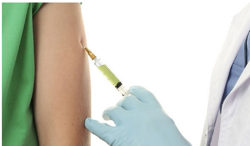
Muchos facultativos desconfían de la eficacia de las vacunas; a otros, sin embargo, les da miedo sus efectos secundarios.

Al médico que ejerce en el SNS no le gusta vacunarse. Las razones que esgrime son de lo más variopintas: miedo a las agujas, a los pinchazos y a los efectos secundarios. Pero no son sus únicas justificaciones. La mayoría argumenta que desconfía de la eficacia de las vacunas.